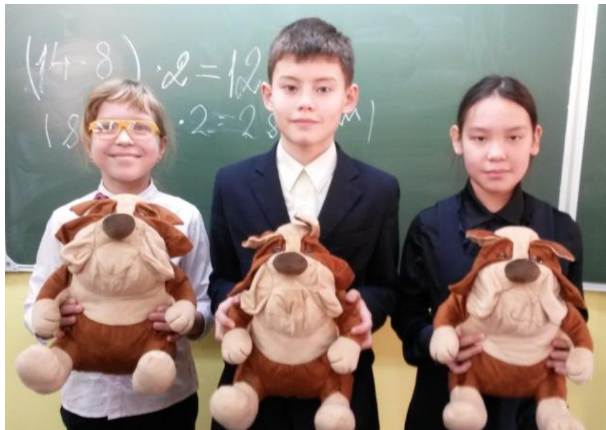
Победители БРИТИШ бульдог.